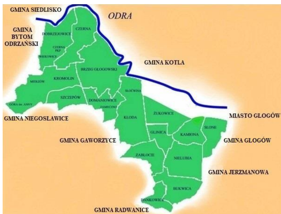
Rysunek 1 Położenie gminy Żukowice.

Gminę tworzy 20 miejscowości połączonych w 15 sołectw: Brzeg Głogowski, Bukwica, Czerna, Dankowice, Dobrzejowice, Domaniowice, Glinica, Kamiona, Kłoda, Kromolin, Nielubia, Słone, Szczepów, Zabłocie i Żukowice.